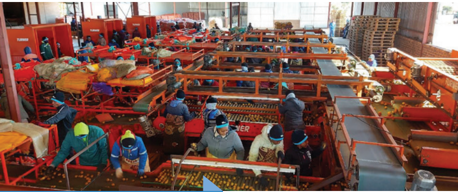
Firna (Edms.) Bpk. se sorteeraanleg.

Carbrecht – ook onder die top drie moerkwekers – naby hulle. Verder word 'n sewe- tot tien-jaar rotasie toegepas met slegs peulgewasse, gevolg deur borseltjiegras, voor daar weer moeraanplantings gemaak word op goeie, stikstofryke grond met 'n perfekte pH. Hulle is ook gelukkig dat die gronde baie homogeen is.