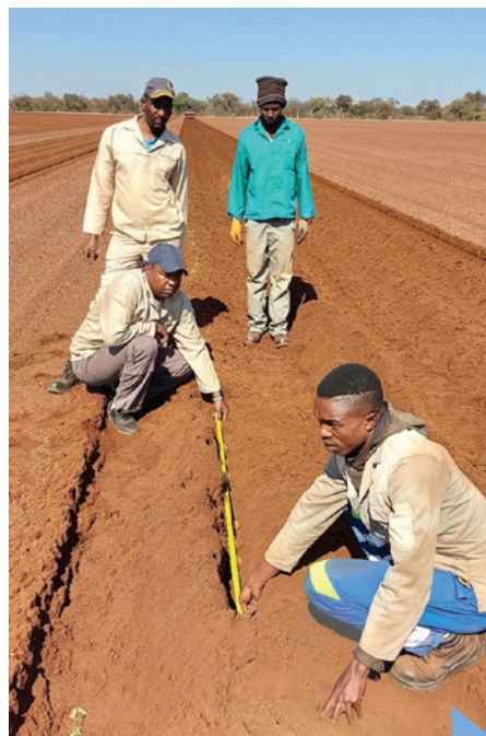
Die planter se akkuraatheid word hier bevestig.

Enigiets wat verdag lyk word met knol en al uitgehaal en uit die lande gedra. Die suiweringspanne beweeg twee maal per week deur die lande. Abrie weet presies hoeveel plante op watter tye deur die seisoen gesuiwer word. Hy kan dus ASD se data verifieer, suiwer en die afplating in infeksie oor die seisoen sien.