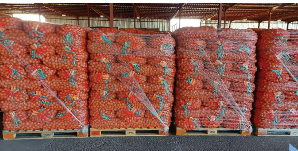
Pallets with seed potatoes neatly bagged, labelled and wrapped are a visible display of the discipline and attention to detail applied by the Carbrecht team.

Lessons learnt have certainly paid off as the certification data ranked them as one of the finalists for the Bayer Seed Grower of the Year award. 🍌